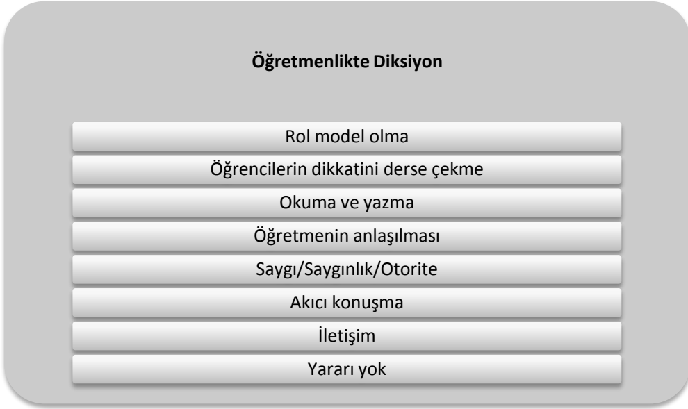
Şekil 2. Öğretmenlikte Diksiyon Teması

Öğretmen adaylarından Ö19: “Öğrencilere rol model olduğumuz için, onlara iyi bir örnek olmak için ve düzgün iletişim için bize yararlar sağlar.” şeklinde görüşünü ifade ederek diksiyonun öğretmen için rol model olma ve iletişim kurma konularında önemli olduğunu belirtmiştir. Derste anlatılan konuların anlaşılmasına ilişkin olarak Ö25: “Öğrencilerin anlatılan konuları anlamasını kolaylaştırarak, öğrencinin ilgisini çekebilmemizi sağlar.” şeklinde görüşünü ifade etmiştir. Bu bağlamda belirtilen görüş diksiyonun, öğretmenin anlaşılmasını ve öğrencinin dikkatini derse çekmesini sağladığını belirtmektedir.